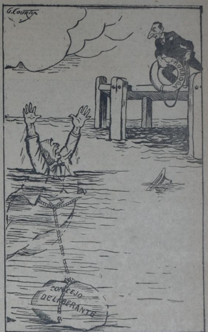
Accionista tranviario — ¡Socorro! ¡Socorro, amigo intendente! Noel — ¡Animo! Aguanté firme por dos meses, amigo, y lo voy a regalar el boleto de 15 centavos!